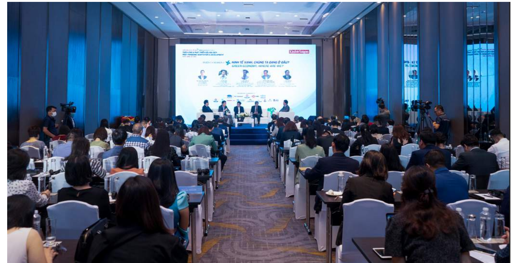
Ban Biên tập Tạp chí Kinh tế Sài Gòn trao hoa cho các diễn giả; Toàn cảnh hội trường tại phiên thảo luận 1, Diễn đàn Kinh tế Xanh 2022

Bên cạnh các diễn giả là chuyên gia đầu ngành và lãnh đạo các doanh nghiệp, diễn đàn còn có sự góp mặt của đại diện ngoại giao đoàn các nước (Ý, Thái Lan,...) tại Việt Nam.