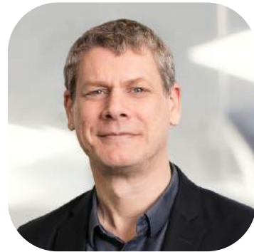
GS.TS. JONATHAN PINCUS Chuyên gia kinh tế quốc tế cao cấp, của UNDP

Net Zero, một trong những thách thức lớn nhất mà loài người đang đối mặt. Tham luận này bàn về hành trình này có khả thi hay không; cách thức nào để giảm thải và hấp thụ trong quá trình sản xuất để cân bằng và để phát triển một nền kinh tế xanh, bền vững.